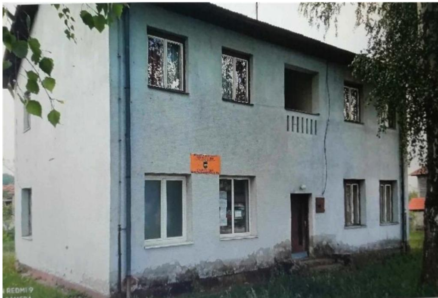
Slika 3. Izgled zgrade stare osnovne škole – sagrađena 1954.g.