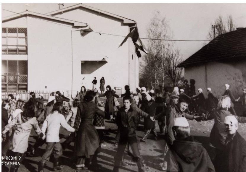
Slika 5. Na slici je vidljiva seoska čitaonica – na desnoj strani slike. Na istoj slici je zabilježeno kozaračko kolo ispred zgrade nove osnovne škole na dan otvaranja škole 29.11.1977. godine.