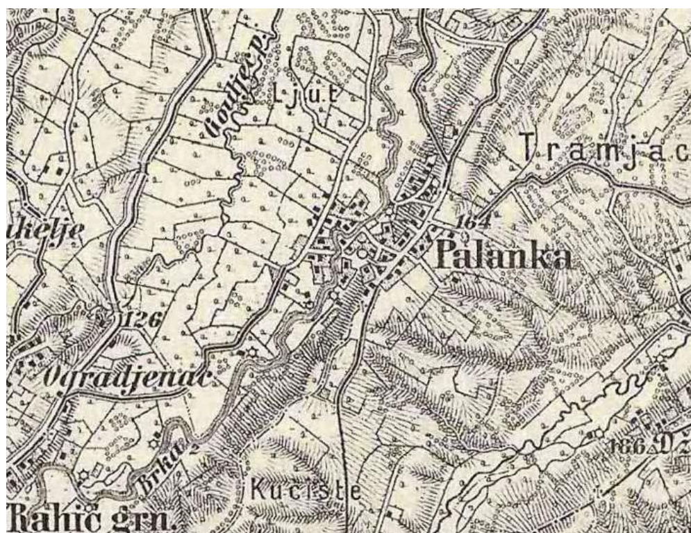
Prilog 1. Palanka na topografskoj karti sa kraja 19. stoljeća

Preko naselja starinom vodi i važan put pravca sjever-jug. Počinjao je u Brčkom i išao preko naselja Brod, gdje je prelaz (brod) i most preko rijeke Brke (odatle i naziv navedenog naselja). Ovaj stari put zatim ide desnim ravodšem doline rijeke Brke, blagim gredama, prolazi kroz istočni najviši dio naselja, pored starog groblja na jugu naselja a onda ka Zoviku. U Zoviku prolazi pored starih begovskih kula i čardaka Zaimovića i u Velinom Selu se upaja na najvažniji put iz Brčkog, preko planine Majevice za Dolnju Tuzlu.