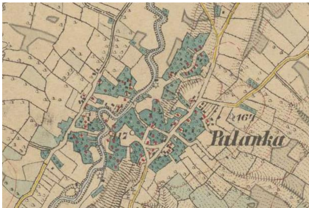
Prilog 2. Palanka na najstarijoj topografskoj karti iz 1885. godine