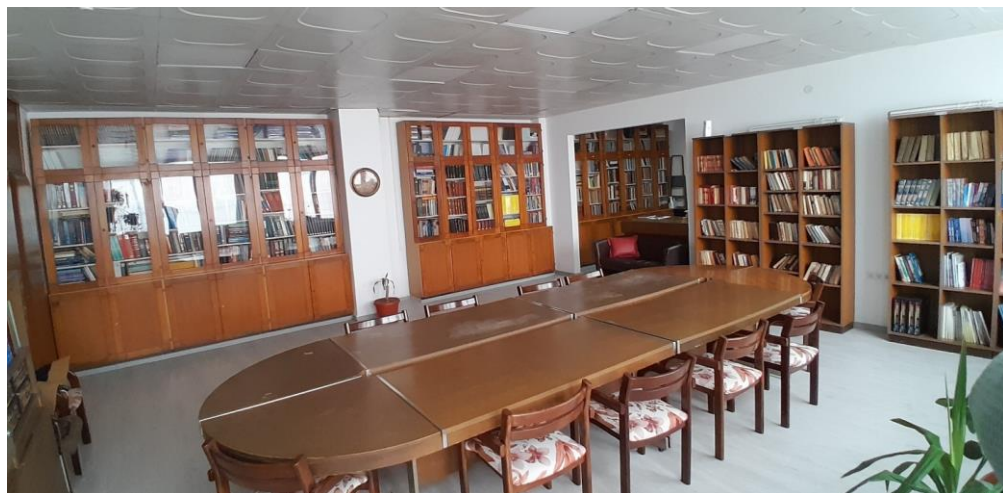
Slika 5. Dio prostora Centralne biblioteke JZU UKC Tuzla

Sva spomenuta pojedinačna izdanja, kao i svi brojevi časopisa Pedijatrija danas/Paediatrics Today/Central European Journal of Paediatrics i Acta Medica Saliniana , danas se mogu pronaći u Centralnoj biblioteci JZU UKC Tuzla (sl. 5). Listovi 17. oktobar i Bilten (Zdravstvene novine, Vjesnik, e-Vjesnik) dostupni su u Narodnoj i univerzitetskoj biblioteci „Derviš Sušić“ Tuzla i u Sektoru za informacione tehnologije JZU UKC Tuzla.