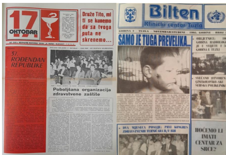
Slika 4. Naslovna strana 50. broja lista „17. oktobar“ (maj 1980. godine) sa posvetom Josipu Brozu Titu naspram naslovne strane jednog od dva „ratna“ broja lista „Bilten“ (novembar 1995. godine) sa simbolom ljiljana

i tekstove prožete izrazito političko-propagandnim konotacijama. Tako je ime Josipa Broza Tita, „vodećeg neimara i tvorca socijalističke samoupravne Jugoslavije“ i „vodeće ličnosti nesvrstanog svijeta“, kako su ga autori tekstova opisivali, sveukupno gledano, najčešće spominjano ime u izdanjima 17. oktobra . Titov lik znao je krasiti i naslovnice ovog lista, a nakon njegove smrti, tačnije od pedesetog broja (maj 1980. godine), u zaglavlju svake naslovnice nalazio se natpis: " Druže Tito, mi ti se kunemo da sa tvoga puta ne skrenemo... " (sl. 4).