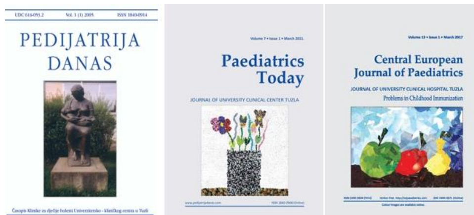
Slika 3. Naslovne strane časopisa pod svakim od tri zvanična naslova

Časopis izlazi dva puta godišnje, pa je u periodu od 2005. do 2022. godine objavljeno 36 njegovih izdanja, te u njima više od 430 naučnih, stručnih, preglednih i drugih vrsta radova. Danas je indeksiran u nekim od vodećih svjetskih naučnih baza, kao što su British Library Direct, Scopus, Crossref, Infobase Index, EBSCO Host ili Cabi, a sva njegova izdanja dostupna su i u online formatu na web stranici časopisa (ISSN: 2490-3671). 9 Kroz cijelo vrijeme njegovog postojanja, glavni i odgovorni urednik časopisa je akademik Husref Tahirović.