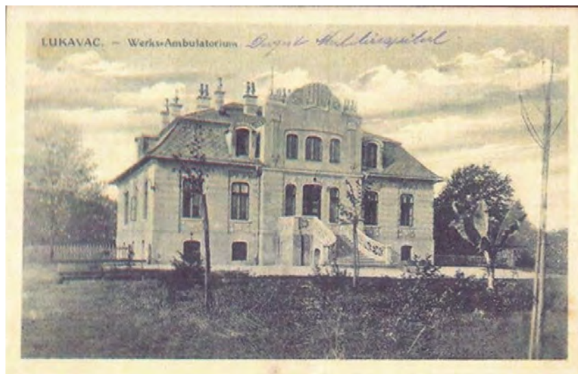
Fotografija vile iz 1914. godine

svjetskog rata. Uprkos tome, dr. Hempt je do 1914. godine u „Vili“ otvorio zdravstvenu ustanovu – „Fabrikspital“ ili „Werks Ambulatorium“, u narodu prozvanu „mala bolnica“ koja je bila opremljena najsavremenijim medicinskim sredstvima toga perioda. 38