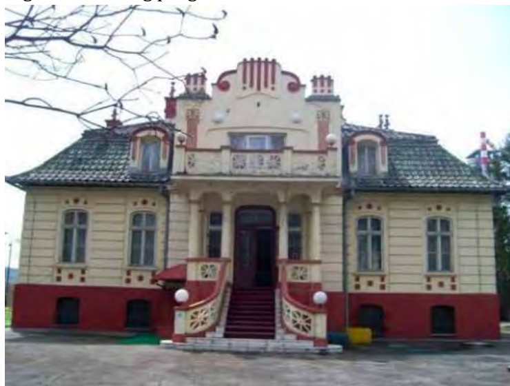
Vila Solvay, sjeverna fasada

Fasade objekta nisu stilski strogo definirane, te je moguće raspoznati dekorativne elemente koji odražavaju estetiku secesije, ali i elemente historicističkog dekorativnog programa.