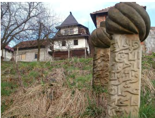
Stari nišani u blizini Čamdžića kuće. desni nišan Osmana Čamdžića iz 1920. Godine

Godine 2010. vršeni su radovi redovnog održavanja objekta i tom prilikom vlasnik je drveni krovni pokrivač (šindru) zamijenio limenim. Treba istaći da je stari drveni pokrivač, odnosno njegovi ostaci još uvijek sačuvan i nalazi se odložen neposredno uz kuću.