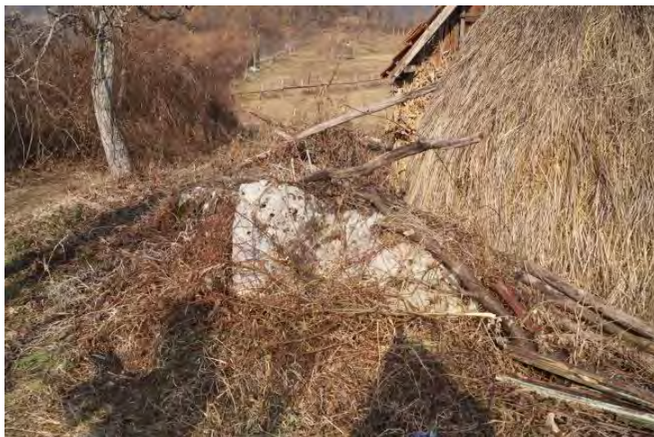
stećak sljemenjak, oštećen, lok. Zagrobnice

Primjer imamo u općini Teočak tačnije naselje Sniježnica. Nekropola se nalazi sa desne strane puta u centru naselja Sniježnica. Stećci su smješteni u jednom dijelu ograđenog mezarja koje je i danas aktivno i pored šehidskog spomen obilježja i šehidskog mezarja iz zadnjeg rata. Na terenu smo izbrojali 13 stećaka, tri sanduka, pet sljemenjaka, jedan stub i četiri ostatka stećka (tj. stećci neutvrdivog oblika) 2 .