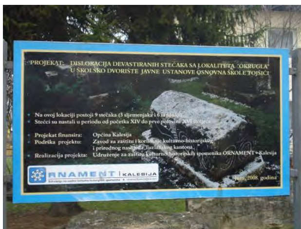
uređena nekropola sa stećcima, Tojšići

Kalesija - Tuzla 11 . Sve tri nekropole uređene su u saradnji sa JU Zavod za zaštitu i korištenje kulturno-historijskog i prirodnog naslijeđa TK 12 .