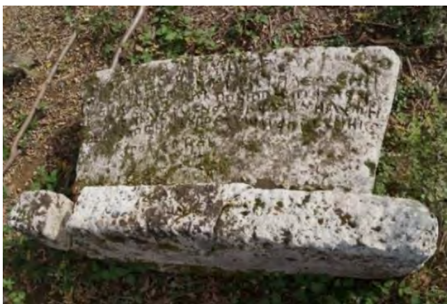
stećak sljemenjak, prevrnut, oštećen, lok. Brkića groblje

Na osnovu dostupnih podataka, u ovoj nekropoli nekada je bilo više stećaka, gdje je Šefik Bešlagić evidentirao 30 stećaka. Također, Š. Bešlagić je u ovoj nekropoli evidentirao i jedan stećak u obliku stuba s natpisom u kojem se navodi ime Dragac Tihmilić 5 .