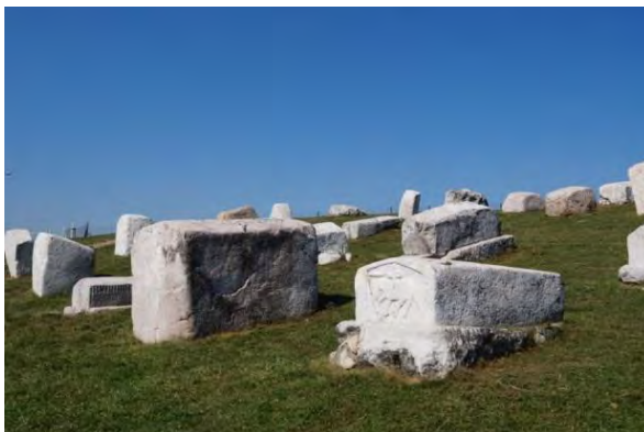
nekropola sa stećcima, lok. Rajsko jezero

stubova i tri neutvrđenog oblika. Stećci su raspoređeni u nizove s orijentacijom sjever – jug 13 .