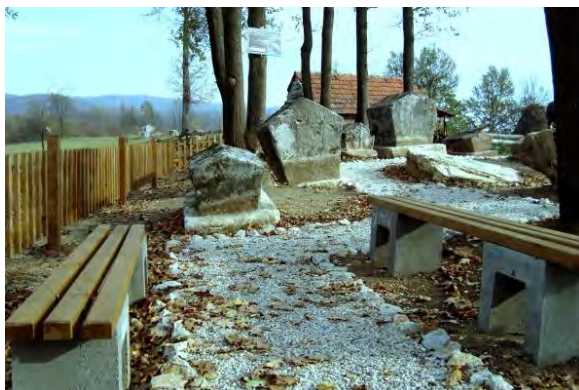
uređena nekropola sa stećcima, lok. Mramorje

Nekropola na lokalitetu Mramorje, naselje Miljanovci, mahala Bukvari, općina Kalesija je 2009. godine uređena i ograđena drvenom ogradom. Projekat uređenja nekropole realizovalo Udruženje za zaštitu kulturno-historijskih spomenika „ORNAMENT“ Kalesija. 10