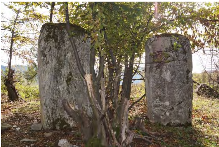
nekropola sa stećcima, Noćajevići

Uz saradnju sa Kantonalnom upravom civilne zaštite Tuzla, općinom Kladanj i BH MAC-om 2017. godine urađen je projekat deminiranja a već tokom 2018. godine parcela je očišćena od minsko-eksplozivnih sredstava. U toku je izrada projekta uređenja nekropole.