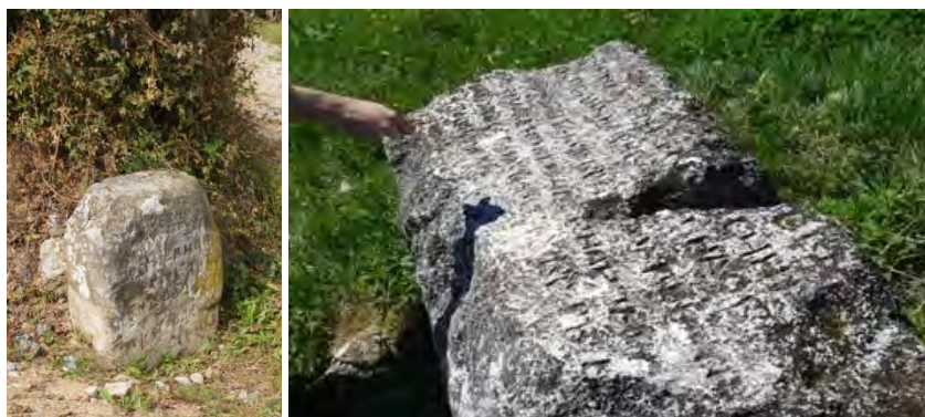
stećci sa natpisom, Sapna, Čelić

Isti primjer su i pojedinačni stećci samotnjaci. Jedan stećak po obliku stub u naselju Zaseok, općina Sapna 9 i stećak sljemenjak na lokalitetu Do u naselju Vražići u općini Čelić. Oba ova stećka na sebi imaju uklesane natpise pisane bosančicom. Treba naglasiti da će oba navedena stećka biti uništena ako se ubrzo ne poduzmu mjere zaštite.