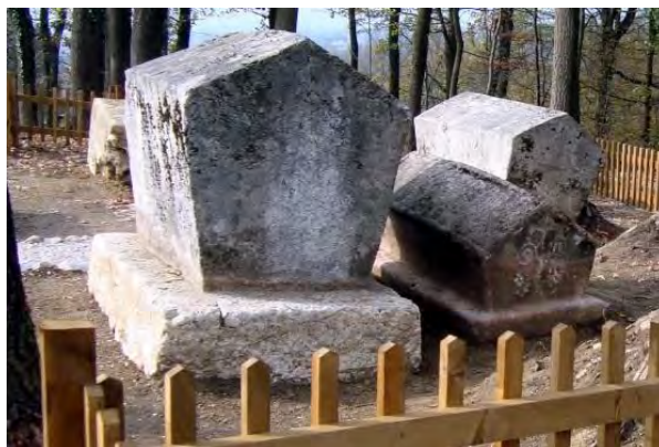
uređena nekropola sa stećcima, lok. Mramorje

Isto udruženje je uradilo i realizovalo projekat uređenja nekropole u naselju Bulatovci na lokalitetu Mramorje koja danas ima status nacionalnog spomenika.