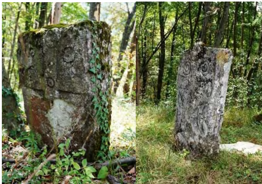
nekropola sa stećcima, lok. Stare kuće, Breške

Realizacija projekta za koji je finansiska sredstva obezbijedila Općina Tuzla treba biti započeta u proljeće 2019. godine.