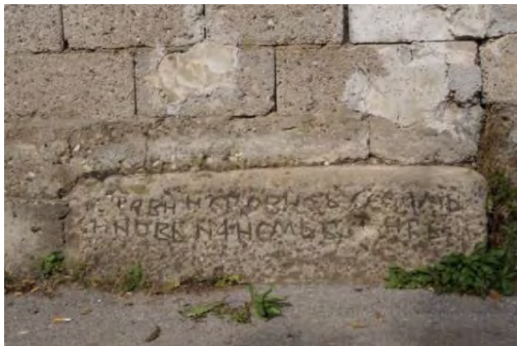
stećak sljemenjak upotrebljen kao građevinski materijal

Primjer imamo u općini Teočak tačnije naselje Sniježnica. Nekropola se nalazi sa desne strane puta u centru naselja Sniježnica. Stećci su smješteni u jednom dijelu ograđenog mezarja koje je i danas aktivno i pored šehidskog spomen obilježja i šehidskog mezarja iz zadnjeg rata. Na terenu smo izbrojali 13 stećaka, tri sanduka, pet sljemenjaka, jedan stub i četiri ostatka stećka (tj. stećci neutvrdivog oblika) 2 .