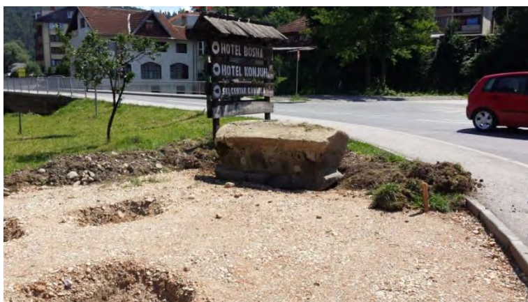
radovi na izmještanju stećaka