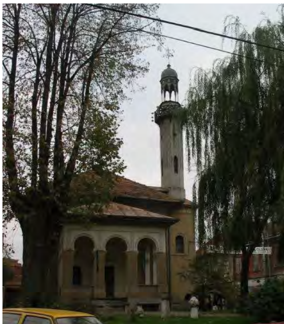
Fotografija 2 – Šarena (Časna, Atik, Gradska, Behram-begova) džamija u Tuzli