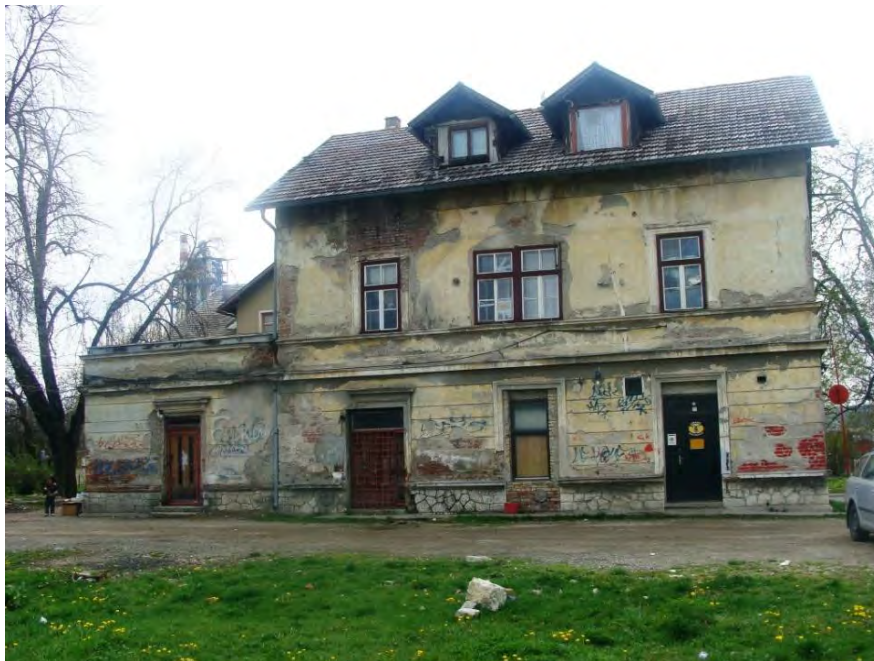
Fotografija 5 – Željeznička stanica u Lukavcu – Arhiva Komisije za očuvanje nacionalnih spomenika, 2015. godina