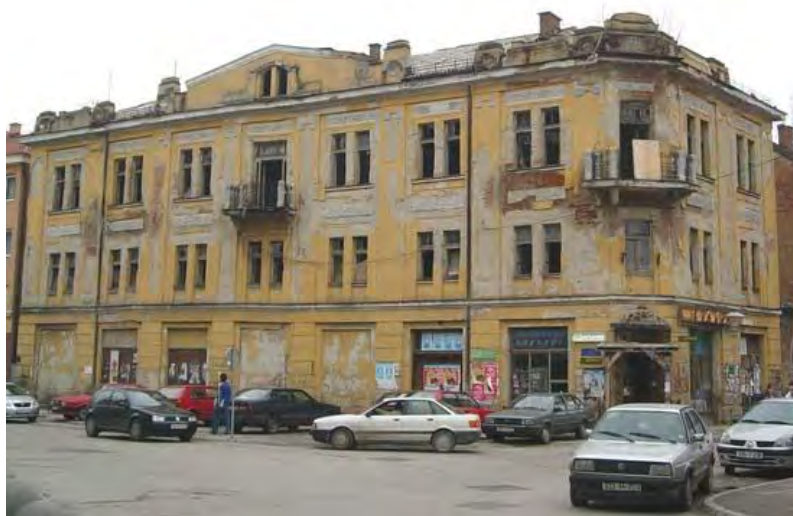
Fotografija 6 – Kino Centar („Koloseum“) u Tuzli – Arhiva Komisije za očuvanje nacionalnih spomenika, 2015. godina