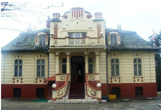
Fotografija 8 – "Vilu Solvay" u Lukavcu – Arhiva Komisije za očuvanje nacionalnih spomenika, 2015. godina