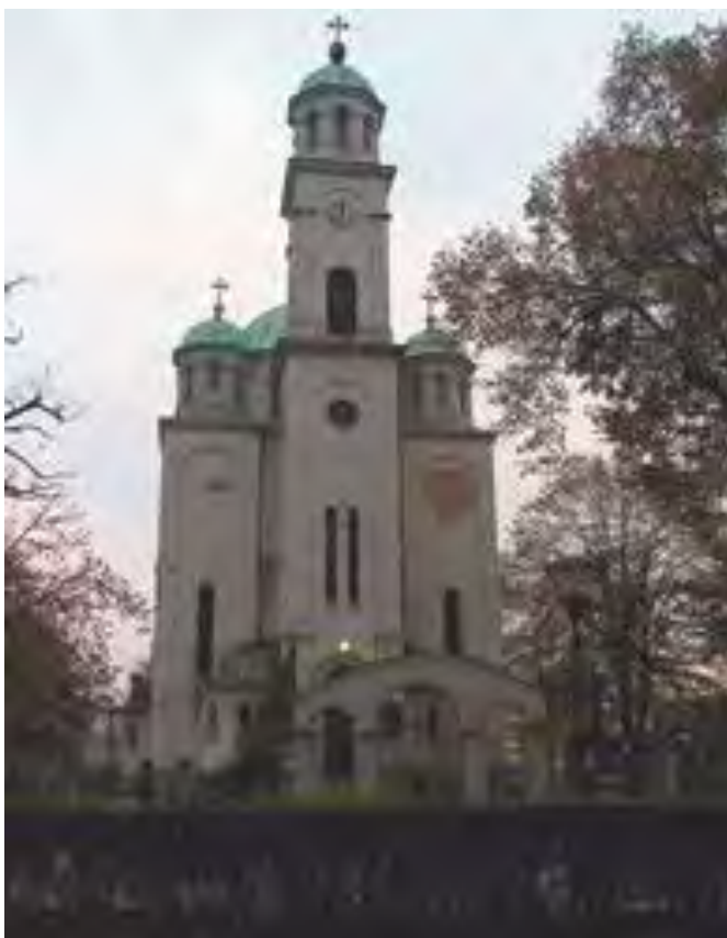
Fotografija 1 - Saborni hram Uspenja Presvete Bogorodice u Tuzli - https://www.bastina.ba/index.php/2016-04-12-11-50-38/nacionalni-spomenici-na-prostoru-tuzle/127-saborni-hram-uspenja-presvete-bogorodice-sa-pokretnim-naslijeem-historijska-graevina - Web stranica JU Zavoda za zaštitu i korištenje kulturno-historijskog i prirodnog naslijeđa Tuzlanskog kantona, 24.12.2018.