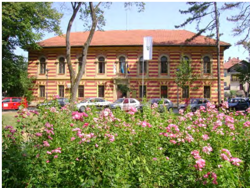
Fotografija 3 – Vijećnica u Gračanici - https://www.bastina.ba/index.php/bastina-sjeveroistocne-bosne-broj-3/40-zavod/vijesti/606-konak-vijecnica-u-gracanic - Web stranica JU Zavoda za zaštitu i korištenje kulturno-historijskog i prirodnog naslijeđa Tuzlanskog kantona, 24.12.2018