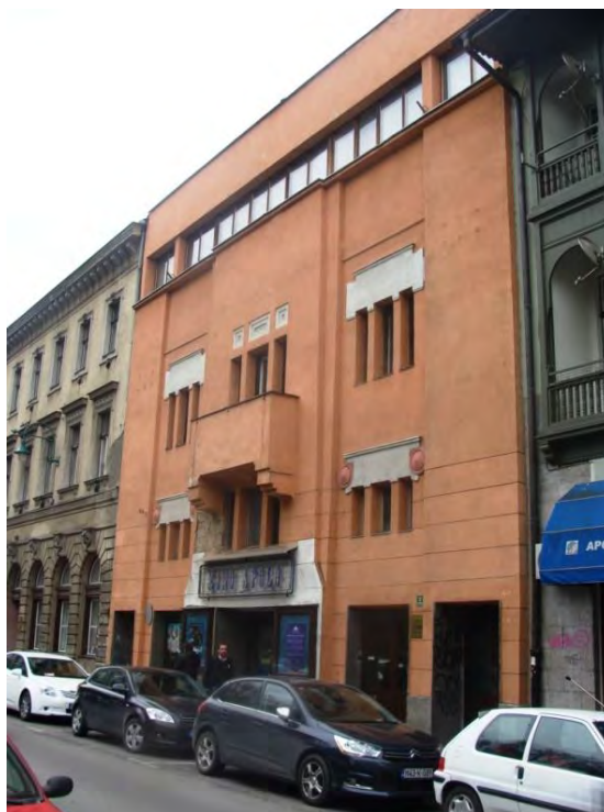
Fotografija 7 – Kino Apolo („Koloseum“) u Sarajevu – Arhiva Komisije za očuvanje nacionalnih spomenika, 2014. godina