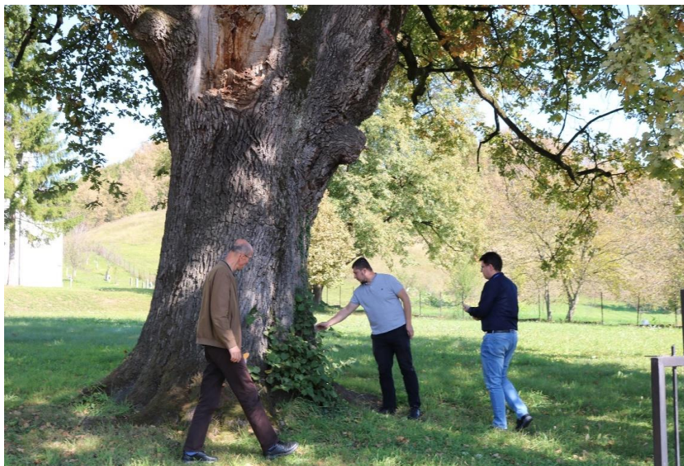
Slika broj 6. Na terenu u Požarnici

Brizi za očuvanje starih stabala prije se pridavala neznatna pažnja. Bilo je pokušaja da se ona zaštite kao i dobronamjernih prijedloga ljubitelja prirode i istaknutih stručnjaka, ali se dosta toga završilo na administrativnim aktima. Iako dendroflora ovoga tipa posjeduje naučnu vrijednost, ista je bila tema vrlo malog broja stručno-naučnih opservacija.