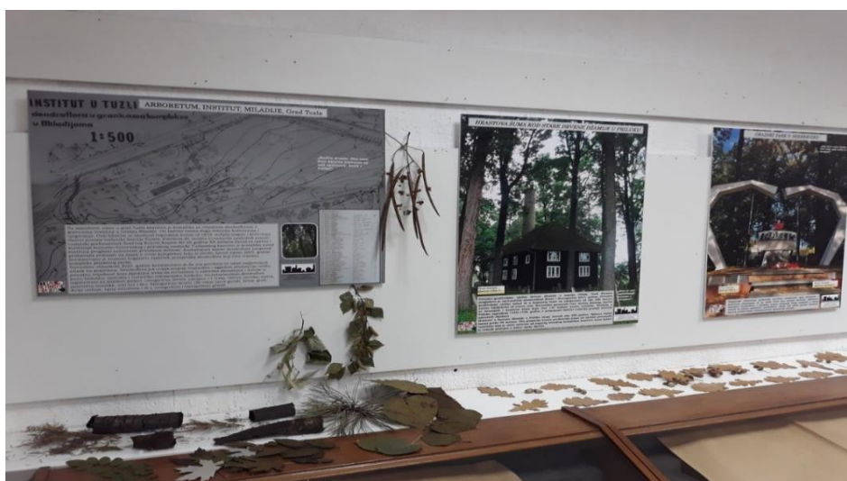
Slika 2. Dio izložbene postavke