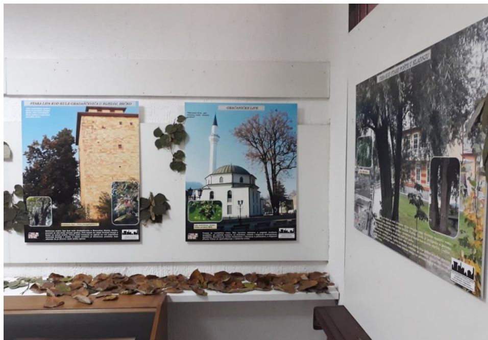
Slika 3. Dio izložbene postavke