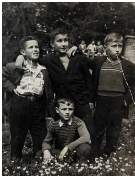
3 FOTOGRAFIJA IZ ŠKOLSKIH DANA, 20.05.1959. SARAJEVO