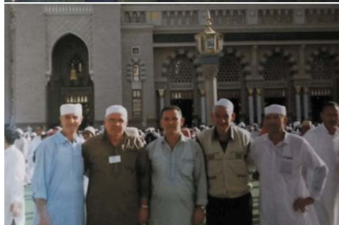
5 EFENDIJA SA DŽEMATLIJAMA I PRIJATELJIMA. PRVA FOTOGRAFIJA ISPRAČAJ DŽEMATLIJE NA HADŽDŽ. DRUGA FOTOGRAFIJA- EFENDIJA NA HADŽDŽ-U