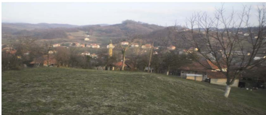
Fotografija nekropole Mramorje Prisadi u zaseoku Gornji Sakići.

Tačan broj stećaka na ovoj nekropoli prije devastacije nije poznat a do danas ih je ostalo sačuvano deset.