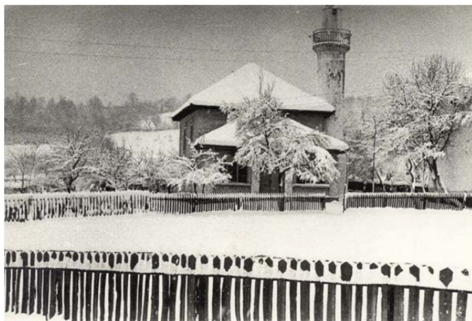
Slika 1. Džamija Bokavići zima 1968/9.