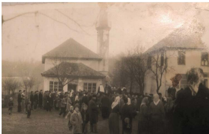
Slika 2. Odlazak hadžija na hadž 1965 godine ispred džamije Bokavići.

Džamija je rekonstruisana i dograđena u periodu avgust i novembar 2000. godine (slika 3.). Stara džamija je ostala sa dodatim novim prednjim dijelom koji je povećao dimenzije. (slika 4). Dimenzije džamije su sada 12,2x15,3 m. Munara je takođe obnovljena i podignuta za još jedan šerefet tako da je ukupna visina sada 42 metra, sa dva šerefeta. Donji dio ćupa je ojačan betonskom stopom a novi dograđeni dio je se izlio od betona. Sve aktivnosti je oko rekonstrukcije vodio je sadašnji imam Mujo ef. Butković i džematski odbor.