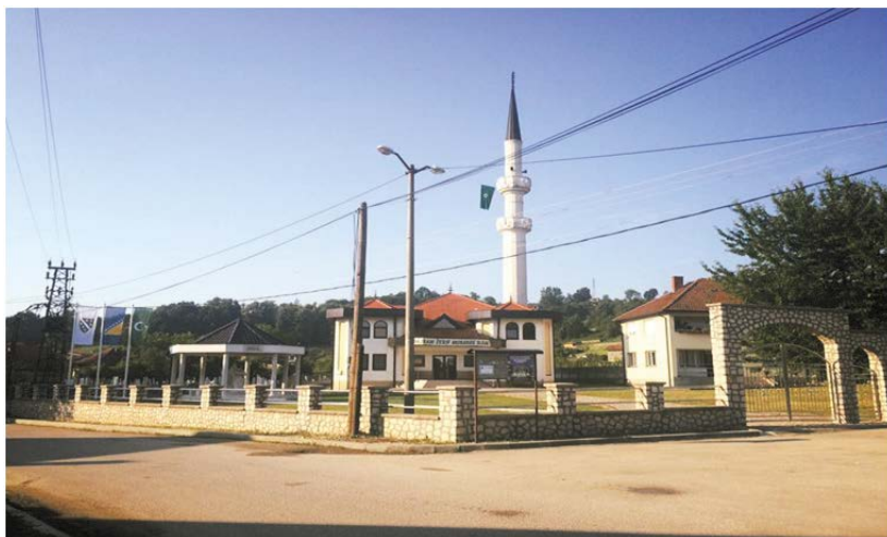
Slika 4. Današnji izgled džamije sa spomen obilježjem palim borcima i šehidima u haremu