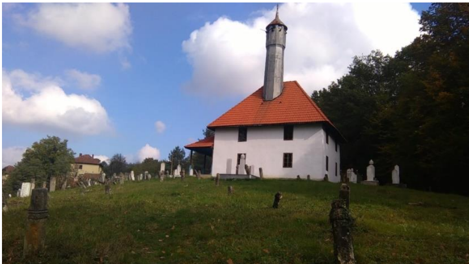
Foto 2. Stara džamija sa haremom u Turiji