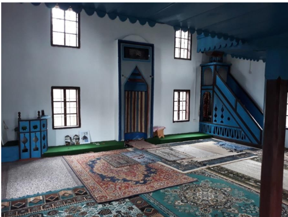
Foto 3. Unutrašnjost stare džamije u Turiji