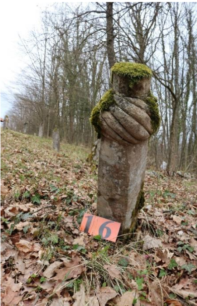
Foto 5. Nišan Jusufa ef, sina Ibrahima i nišan (turban s mudževom) iz 1336. h.g.

općine Lukavac u periodu 2014-2018. godine", Baština sjeveroistočne Bosne. Časopis za baštinu, kulturno-historijsko i prirodno naslijeđe br. 10., Zavod za zaštitu i korištenje kulturno-historijskog i prirodnog naslijeđa TK, Tuzla 2018., 287-316.