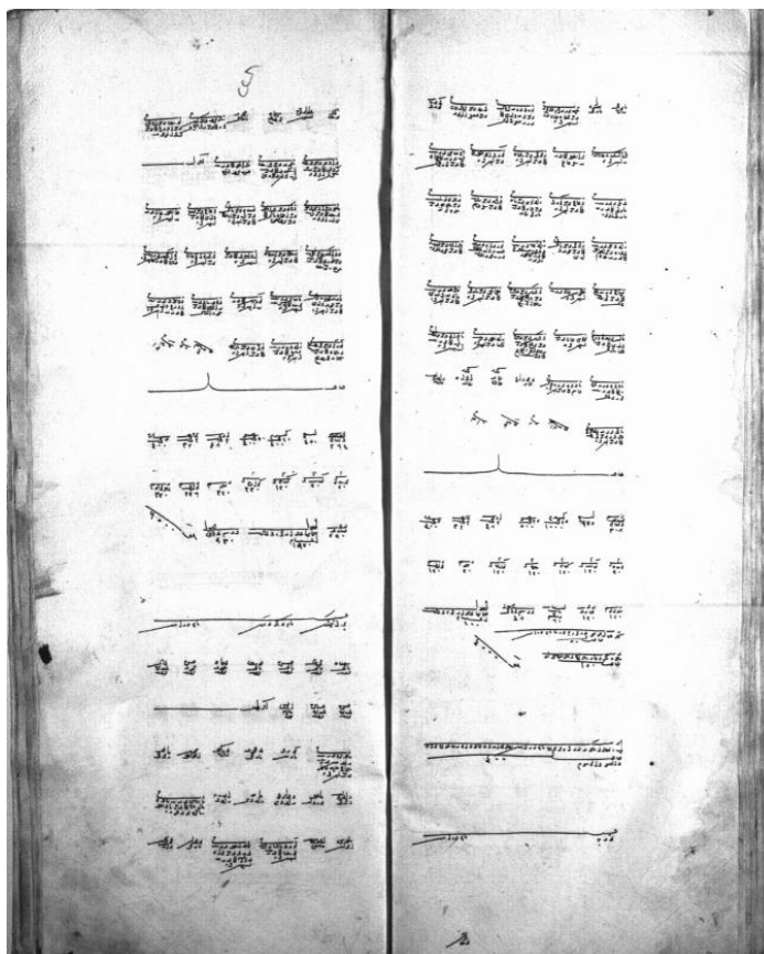
Prilog 1. Izgled originalne stranice deftera iz 1604. godine 11

Sve do kraja 19. stoljeća naselje Turija je obuhvatalo manji prostor jugoistočno od okuke rijeke Turije. Tada je naselju Turija pridodat i dio zapadno od rijeke Turije sa starom mahalom Dubravići, koja je do tada pripadala Milinom selu.