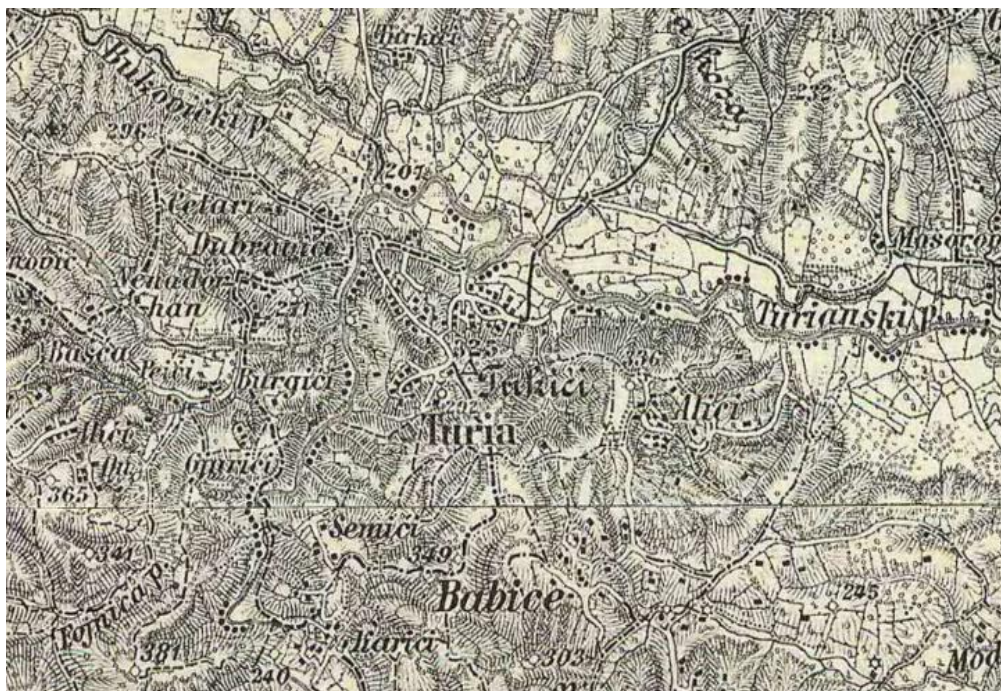
Prilog 3. Turija i okolina krajem 19. stoljeća Austrougarska topografska karta, 1:75.000