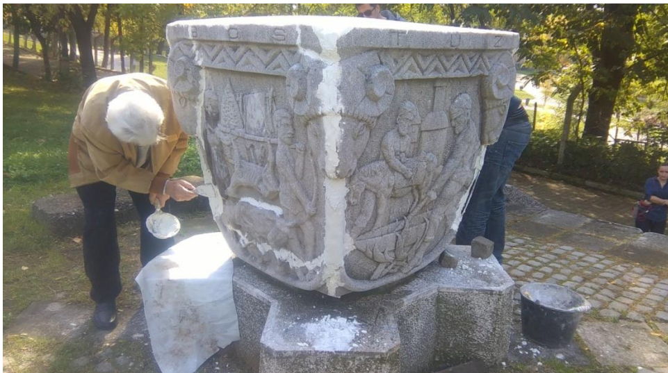
Foto 4. Drugi dan radova, 4. oktobar 2017.