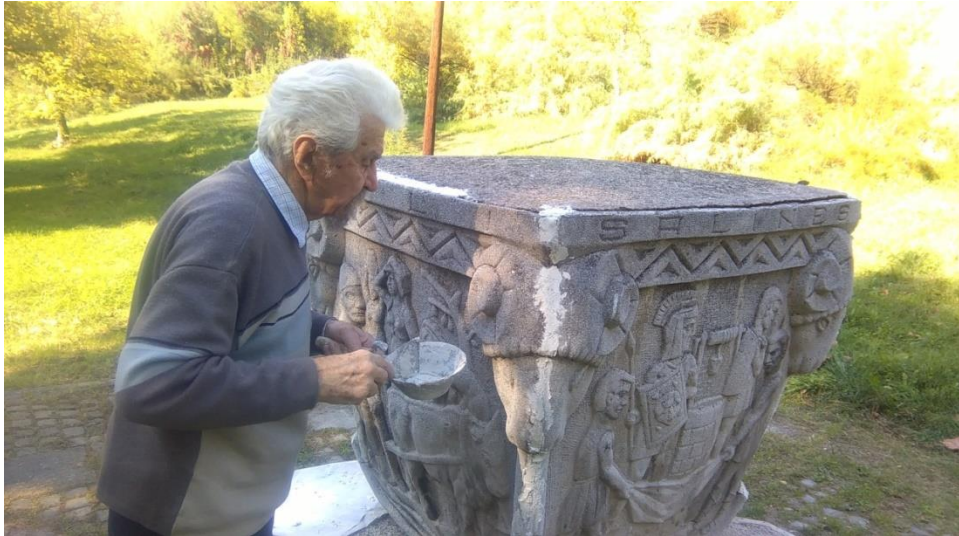
Foto 3. Prvi dan radova, 3. oktobar 2017.

Glavna ispuna je nanošena uglavnom u oštećene osnovne vertikalne ivice na četiri strane spomenika, te uz gornje horizontalne rubove. Tri znatno oštećene ivice su dodatno učvršćene armaturom, a potom ponovo ispunjene navedenom smjesom.