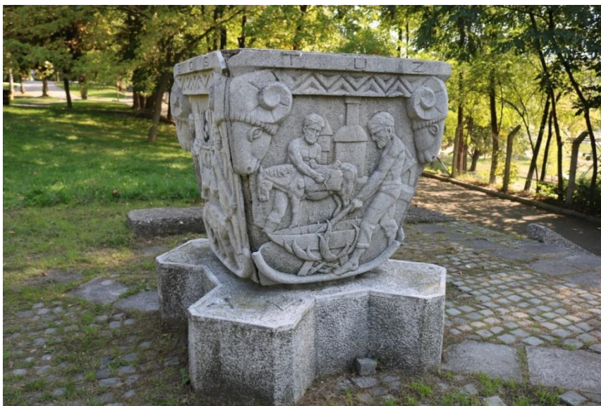
Foto 1. Kapitel prije početka restauracije, 2. oktobar 2017.