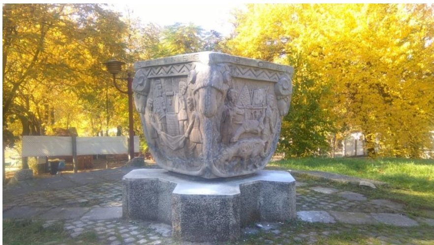
Foto 6. Kapitel poslije završnih radova, 20. oktobar 2017.