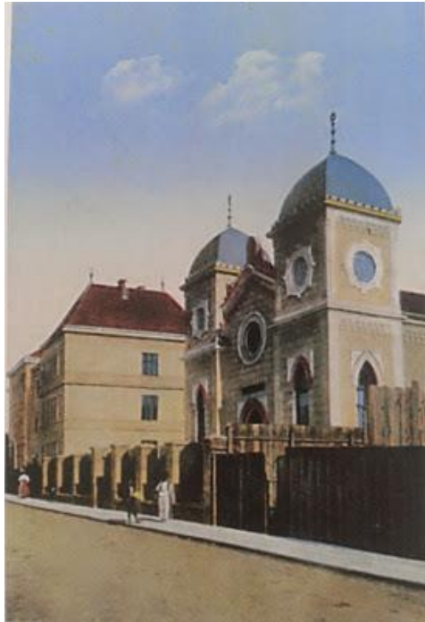
Jevrejska sinagoga u Tuzli (1906. - 1941.)

Nakon 1879. godine, kako je zabilježeno, jevreji Aškenazi naseljavaju prostor Tuzle, osnivaju svoju općinu i grade novu sinagogu. U vrijeme Prvog svjetskog rata, aškenaska općina imala je 400 članova, a sefardska 120 članova. Od 1985. do 1941. godine u Tuzli je rođeno 470 Jevreja. Tokom Drugog svjetskog rata većina tuzlanskih Jevreja odvedena je i usmrćena u fašističkim logorima. Malobrojni preživjeli priključili su se partizanskim jedinicama.