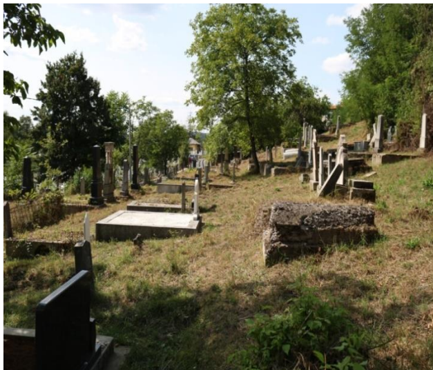
Jevrejsko groblje 17.08.2017.

Ustanovljeno je da trenutno stanje u kojem se groblje nalazi, nije zadovoljavajuće. Neredovno održavanje i sanacija grobnica dovela je do rušenja i uništenja ovog kulturno-historijskog dobra. Svakako, pored ljudskog faktora i njegovog nemara, do uništenja pojedinih grobnica dovelo je i pomjeranje tla.