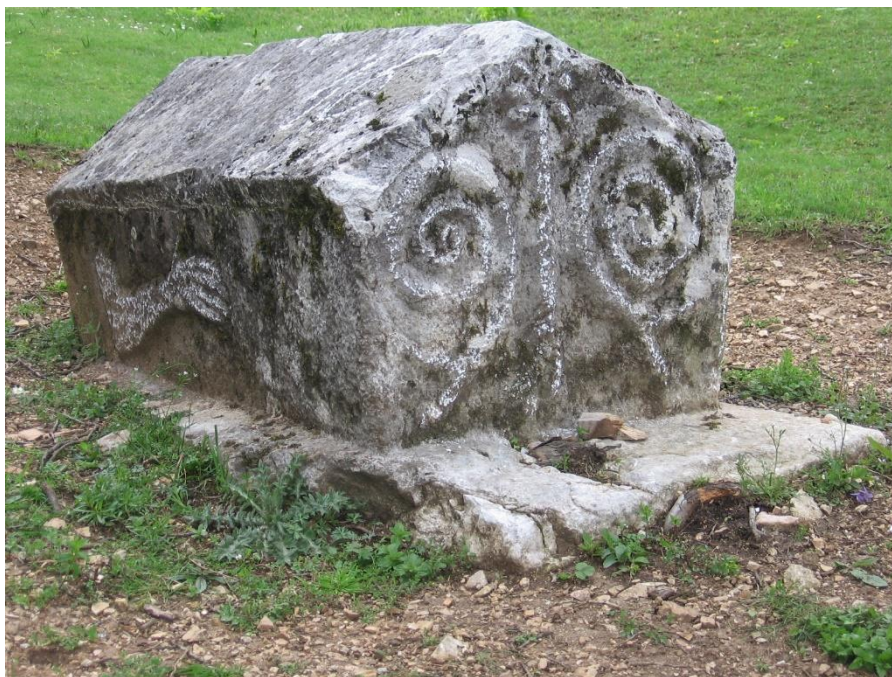
Sl. 19. Stećak br. 16. na lokalitetu Klisa – foto Zijad H 2008. godine