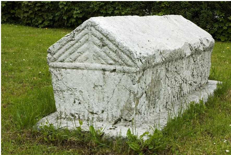
Sl. 11. Stećak premješten sa lokaliteta Klisa kod Olova u baštu ispred Zemaljskog muzeja u Sarajevu – jedinstven zbog svojih plastičnih rebara, koja predstavljaju imitaciju drvenih oblica na srednjovjekovnoj bosanskoj kući 2008. godine