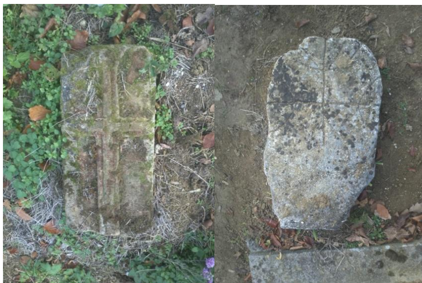
Slika 2: Stari nadgrobnji spomenici na groblju u Tutnjevcu