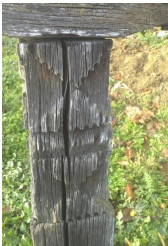
Slika 3: Ukasno rezbarenje na jednom od drvenih križeva