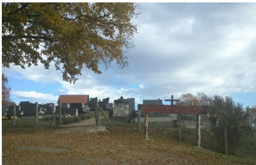
Prilozi: Slika 1: Groblje u Tutnjevcu, župa Špionica