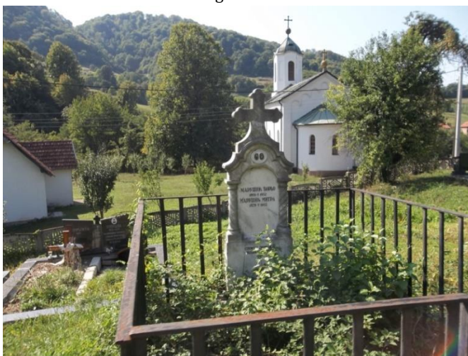
Prilog 2. Podgajevi