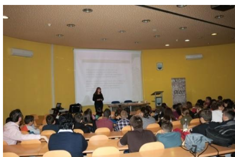
Osnovna škola Katolički školski centar „Sv.Franjo“ Tuzla