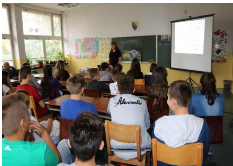
Osnovnoj školi „Memići“ Kalesija