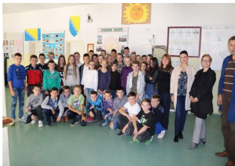
Osnovna škola „Stupari“, Stupari