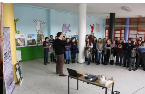
Osnovna škola „Banovići“, Banovići

Ovom prilikom se zahvaljujemo nastavnicima i učenicima osnovnih i srednjih škola, učesnica u projektu „Stećci Tuzlanskog kantona“. Također, u organizaciji Ministarstva trgovine, turizma i saobraćaja Tuzlanskog kantona, 10. oktobra 2017. godine u hotelu Mellain u Tuzli je održan prvi „Turistički forum 2017“. Uz učešće brojnih predstavnika vladinog i nevladinog sektora, akademske zajednice i gostiju, otvorena su aktuelna pitanja stanja, izazova i perspektiva razvoja turizma.