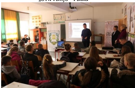
Osnovna škola „Zelinja Donja“, Gradačac