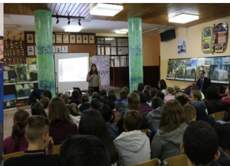
Osnovna škola „Brčanska Malta“ Tuzla