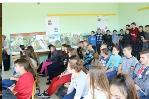
Osnovnoj školi „Kalesija“ Kalesija