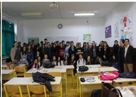
Mješovita Srednja turističko-ugostiteljskoj škola Tuzla