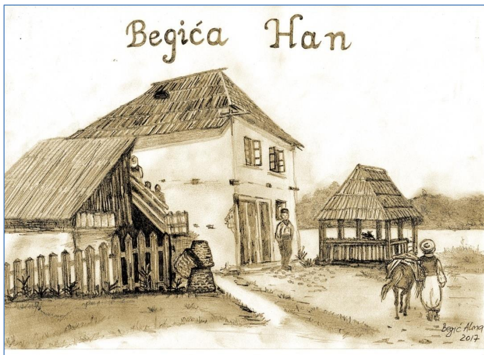
Prilog.3. Begića han – crtež (A. Begić, 2017.)

Pred Drugi svjetski rat Begića Han je imao slijedeće sadržaje: