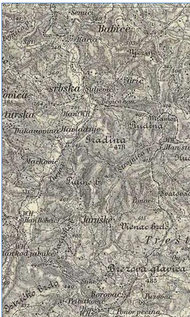
Prilog 1. Jaruške na Austrougarskoj topografskoj karti

Iz osmanskog perioda, 1878. godine Jaruške izlaze kao srednje veliko naselje sa 54 kuće.