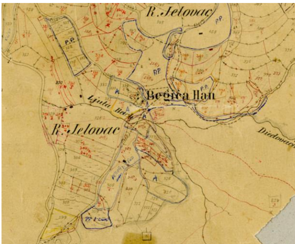
Prilog 2. Okolina Begića hana na Austrougarskom planu