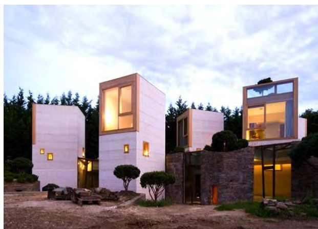
Sl. 20. Kompleks Maison arh. Christian Pottgiesser; postavljanje malih vertikalnih kuća u vidu kompleksa