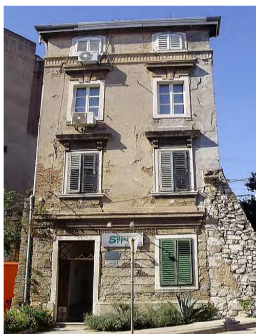
Sl. 15. Kuća u Rijeci – uska i visoka kuća (kula) uslovljena uskom gradskom ulicom