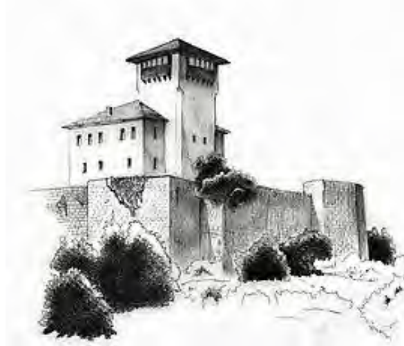
Sl. 4. i 5: Kula Husejn-kapetana Gradašćevića u Gradačcu