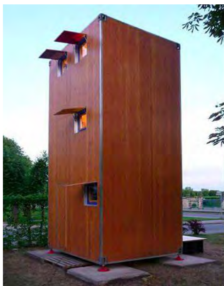
Sl. 17. Homebox -Han-Slawik