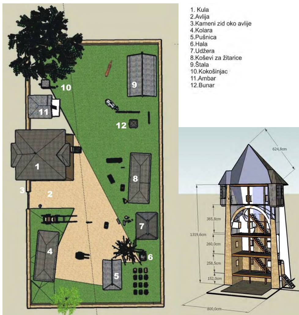
Sl. 10. Tlocrt kule i avlije i vertikalni presjek kroz kulu