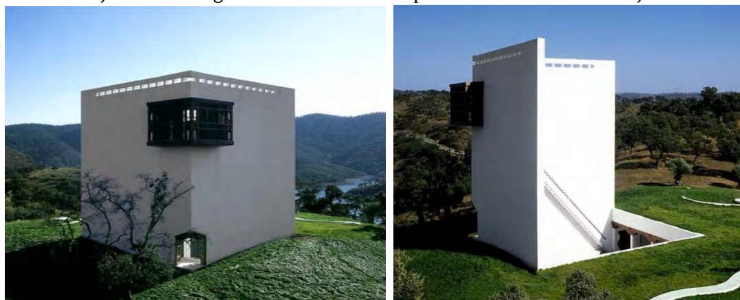
Sl. 12. i 13: Kuća „Cordoba“ od arh. Emilio Ambas i kuća od arm. betona

Postoji još nekoliko primjera u sjeveroistočnoj Bosni gdje su na stambenim i stambeno-poslovnim objektima dodate kule svih oblika i dimenzija i različitih namjena ali isključivo kao dio kuće a ne samostalni stambeni objekat. U svijetu postoji mnoštvo primjera a u zadnje vrijeme je nastao i svojevrsni trend izgradnje stambenih kula od svih materijala i svih mogućih oblika. U radu su prikazane samo neke od njih.