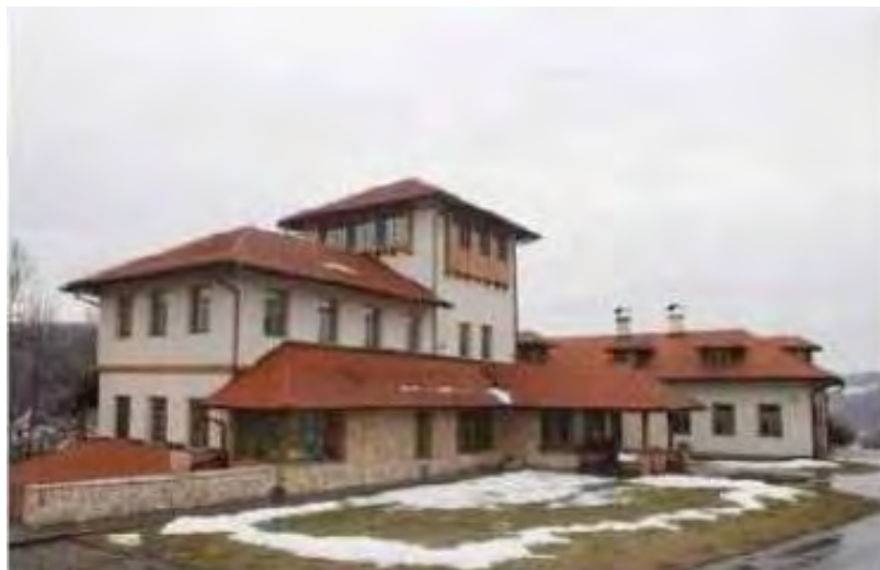
Sl. 11. Kula porodice Širbegović u Gračanici; Stambeni kompleks je izgrađen u tradicionalnom stilu i od prirodnih materijala a središnji i najviši dio čini kula.

Postoji još nekoliko primjera u sjeveroistočnoj Bosni gdje su na stambenim i stambeno-poslovnim objektima dodate kule svih oblika i dimenzija i različitih namjena ali isključivo kao dio kuće a ne samostalni stambeni objekat. U svijetu postoji mnoštvo primjera a u zadnje vrijeme je nastao i svojevrsni trend izgradnje stambenih kula od svih materijala i svih mogućih oblika. U radu su prikazane samo neke od njih.