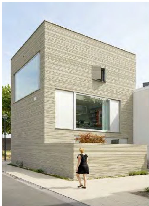
Sl. 16. Kuća „Stripe“ arh. GAAGA