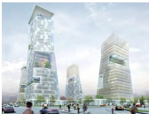
Sl. 18. Stambeno-poslovne kule "Tower II" u N. Beogradu (preuzeto iz časopisa Arhitektura, Beograd, 2012.)