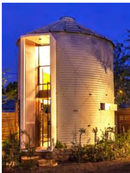
Sl. 19. Silos pretvoren u stambenu Kulu