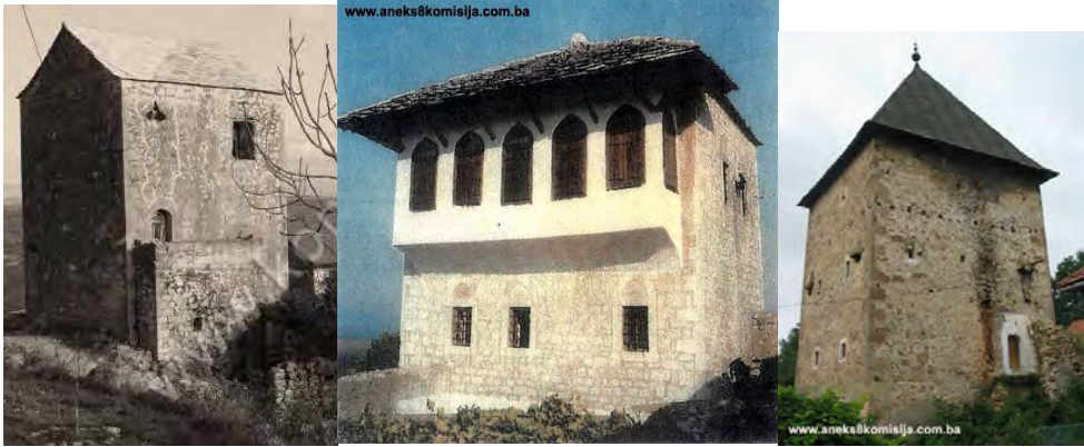
Sl. 1. Lalića kula u Ljubuškom