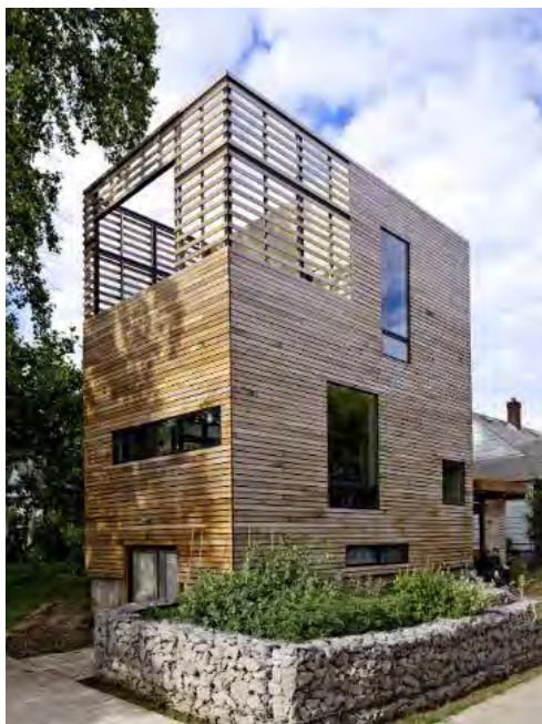
Sl. 14. Kuća „Harpoon“ (stambena kuća od drveta)