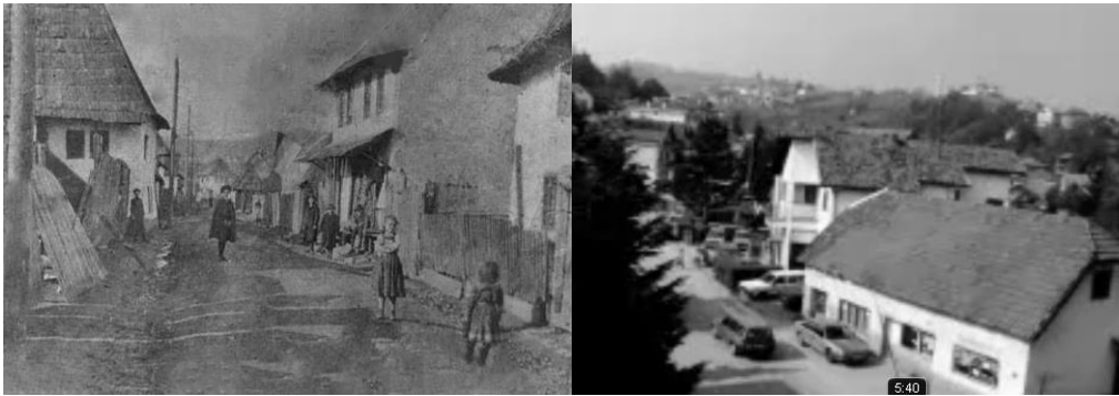
Sl. 6. i 7: Stari izgled Džihana i pekara Muje Čokića u čaršiji