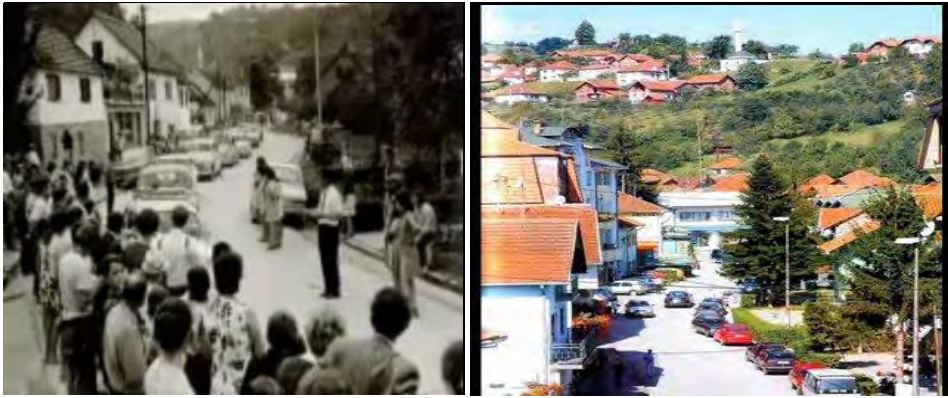
Sl. 4. i 5: Čelić nekad i danas.