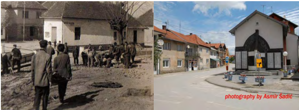
Sl. 2. i 3: Centar Čelića nekada i danas