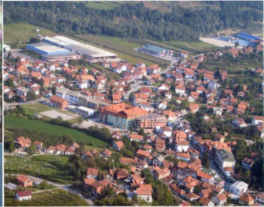
Sl. 14. i 15: čelička čaršija danas i iz zraka