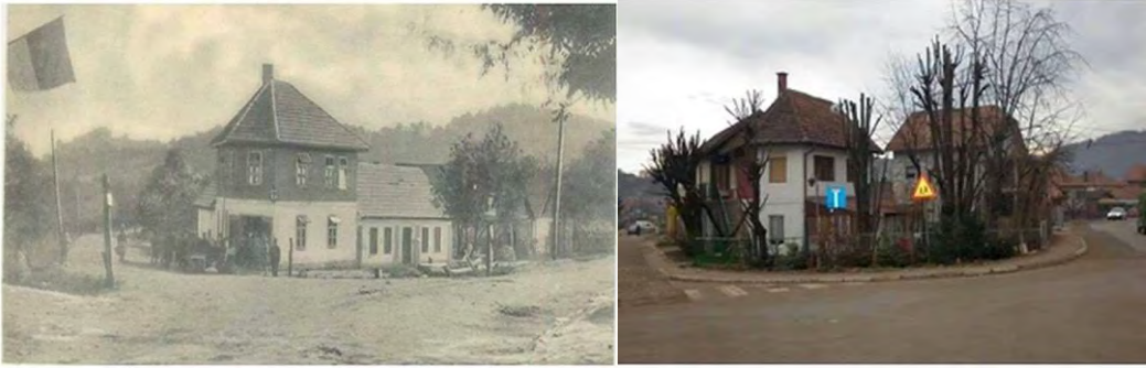
Sl. 8. i 9: Beganovića han nekada; danas kuća porodice Beganović