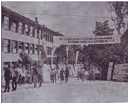
ČELIĆ — domaćin Privredne manifestacije »Dani jagodastog voća« — 1981. godine