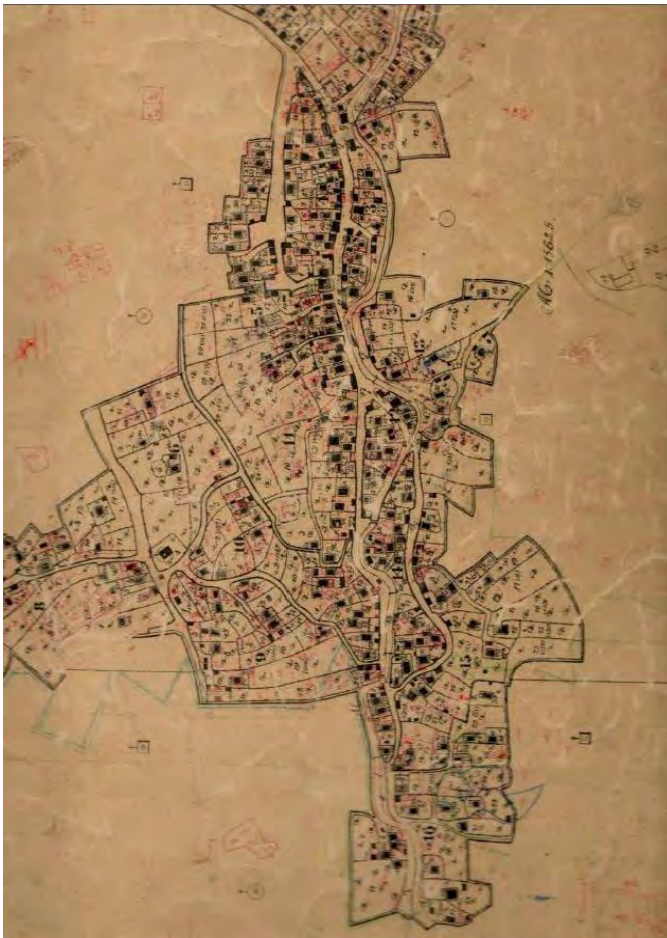
Sl. 1. Austrougarski katarstarski plan Čelića

čaršija mijenjala svoj izgled vijekovima. U srednjem vijeku Čelić je bio pod jakim utjecajem srednjovjekovnog grada Teočaka sa istoka i grada Srebrenika sa zapada, čijoj je banovini i pripadao do početka 16. vijeka. Nakon toga, teritorij čeličke općine nalazi se u nahiji Koraj, kada se i spominje kao Pčelić koji svojim putevima spaja dva srednjovjekovna grada.