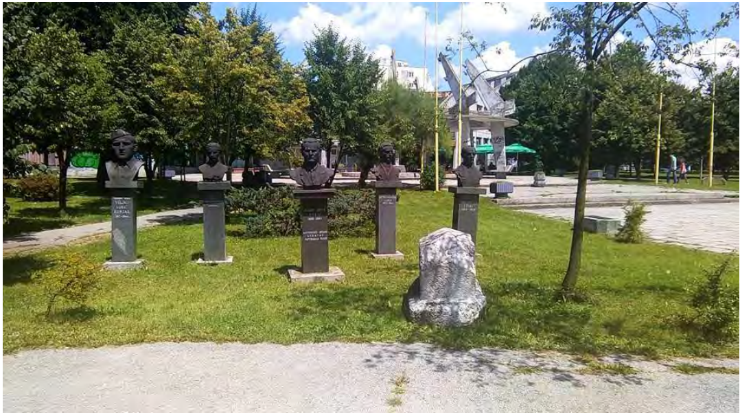
Sl. 3. Stećak u parku ispred Doma kulture u Lukavcu