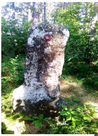
Sl. 2. Usamljeni stećak na lok. Mramor, Babice

Usamljeni stećak se nalazi na lokalitetu „Mramor“ u naselju Babice, cca sedam kilometara zračne linije jugozapadno od Lukavca. Postojanje ovog nadgrobnika prvi evidentiraju Šefik Bešlagić i Ambrozije Benković, 1971. godine.