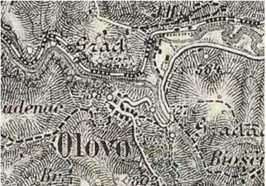
Prilog 1: Olovo na topografskoj karti sa prelaza 19/20. stoljeće