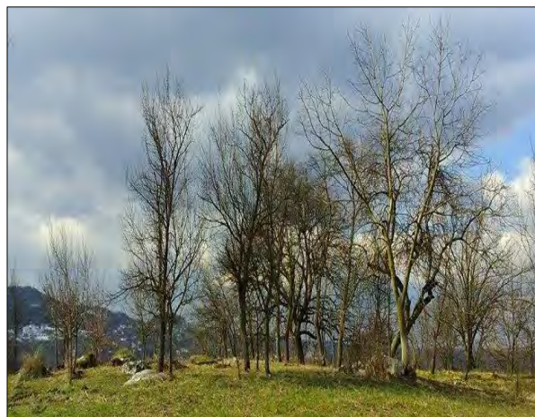
Sl. 2. Nekropola Kamen