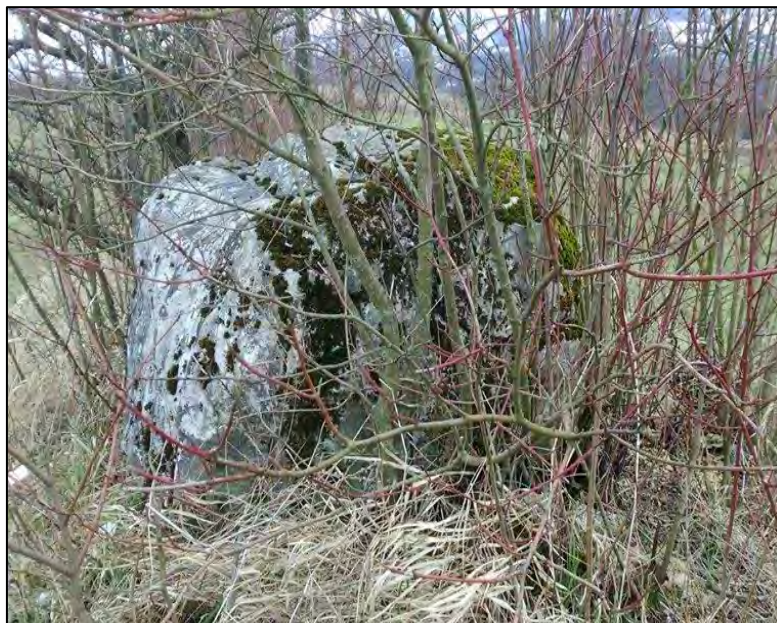
Sl. 8. Usamljeni sljemenak

su uništeni. Slična sudbina sustiže i nadgrobnike na lokalitetu Kamen. Ukoliko se ne poduzmu odgovarajuće mjere zaštite, oni će relativno brzo u potpunosti nestati.