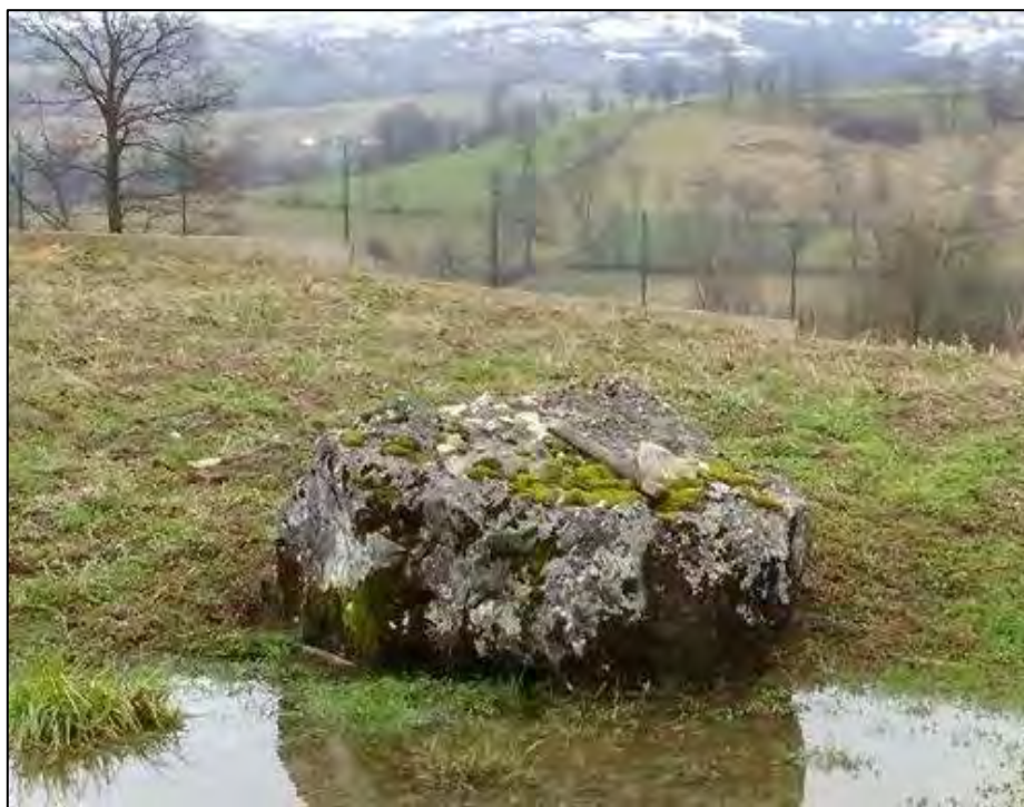
Sl. 7. Oštećeni stećak ispred kuće Sarajlića

Osim navedenih materijalnih ostataka u vidu stećaka ovo naselje posjeduje i neke interesantne toponime poput toponima Zborišta 9 nedaleko od nekropole Kamen u pravcu Potočana. Ovaj toponim je bez sumnje nastao kao odraz društvenog života na ovom prostoru. Zatim toponim Mešćema koja je označavala osmansku sudnicu, odnosno kadijsku rezidenciju u određenom mjestu. Sve navedeno svjedoči da se i u srednjem vijeku na ovom prostoru odvijao aktivan društveni život.