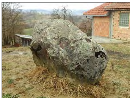
Sl. 4. Stećak ispred kuće Smajića