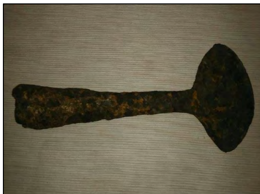
Sl. 5. i 6: Stećak ispred kuće Ćorića i srednjovjekovna alatka pronađena uz stećak

Stotinjak metara u pravcu Potočana sa desne strane puta nalazi se još jedan usamljeni stećak, ispred kuće Hasana Sarajlića (k.č. 69/1). Stećak je u obliku sanduka i