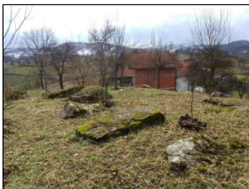
Sl. 3. Dio stećaka sa nekropole Kamen