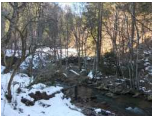
Fotografija 8. Ostaci vodenice

Na ovom području, vodenice, kao i cijeli unutrašnji inventar, izrađuju se od drveta, tako da su vrlo trošne i brzo propadaju. Kameni podzid u temeljima se zida od riječnog kamena, bez ikakvog vezivnog materijala, nema značajnu čvrstinu, tako da se i on s vremenom brzo uruši.