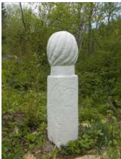
Fotografija 4: Nišan s turbanom, s predstavom luka i obruča/kruga