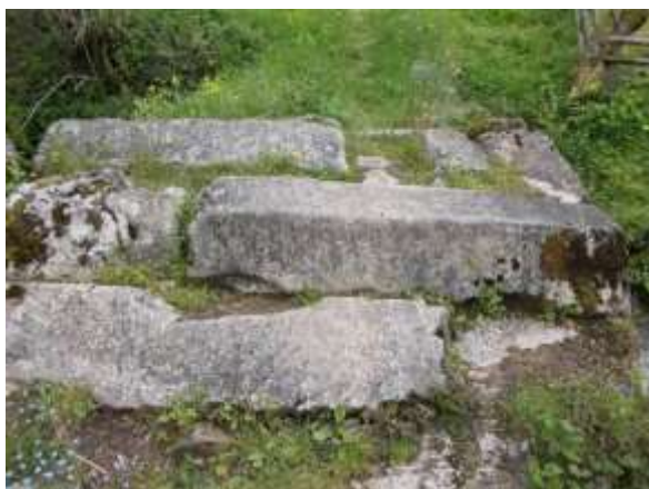
Fotografija 1: Rimski most na rijeci Orliji

Most se nalazi na putu koji je iz grada Olova i okolnih naselja (Bakići, Dolovi, Kruševo, Kozjaci, Musići, Klinčići) vodio preko Očevije prema Varešu. Pomenuta naselja se nalaze na dijelu olovskog kraja, na kojem je postojalo rudarenje rudom olova i dio koji je po svemu sudeći u srednjem vijeku bio gusto naseljen. Taj stari put se iz naselja Klinčići spuštao u dolinu Orlje, preko mosta prelazio Orlju, zatim vodio ka naselju Zagoni i dalje prema Očeviji i Varešu. Na lijevoj strani rijeke put se račvao pa je drugi pravac vodio uz potok Gnjonicu u naselja Ravne i Zubeta i dalje nastavljao prema Varešu. Rijeka Orlja je u gornjem toku mala rijeka, obale su joj pristupačne skoro na cijelom gornjem toku, vodostaj nije velik, osim kad su veće padavine ili topljenje snijega, tako da je čovjek mogao prelaziti rijeku bez nekih posebnih pomagala. Most je sigurno sagrađen za prelaz ljudi kada je vodostaj velik i za lakši prelaz životinja pod teretom (tovarom), s obzirom da je na Orliji postojao veći broj vodenica tako da su sa tovarnim životinjama iz okolnih sela dopremane žitarice za mljevenje a i za ostali transport. Most je sigurno koristio i za lokalnu komunikaciju s jedne obale na drugu, jer sudeći po današnjem rasporedu livada i obradivog zemljišta bio je s obje strane rijeke.