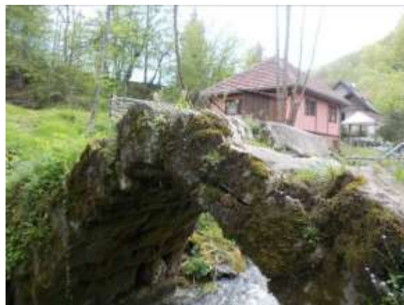
Fotografija 2: Luk mosta

Ovaj stari kameni most je zanimljiv jer je u gradnji mosta korišten materijal nekoliko srednjovjekovnih nadgrobničkih spomenika- stećaka. Stećci su ugrađeni u gornji, danas gazeći dio mosta, tako da su dobro vidljivi. Moguće je da je na mostu nekada bio deblji sloj gornjeg dijela konstrukcije mosta, tako da stećci nisu bili na površini. A moguće je da je graditelj krovne strane stećaka namjerno okretao prema gore da bi gazeća površina bila uglačana. U tom slučaju gazeći dio je neravan zbog stećaka sljemenjaka koji su ugrađeni u most (Fotografija 1). Ukupno je korišteno 4-5 stećaka sljemenjaka i 1-2 u obliku sanduka. Za dva kratka komada nismo sigurni da li se radi o dva kraća stećka ili su dijelovi stećaka. U temeljima i u donjem dijelu mosta nisu korišteni stećci. Bočne strane stećaka, koji su ugrađeni u luk mosta, sužene su prema dolje da bi se uklopile u lučnu konstrukciju mosta. Jedan sljemenjak koji je ugrađen u krunu mosta je sa