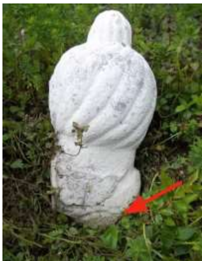
Fotografija 3: Ostaci nišana s dijelom obruča/kruga