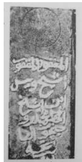
Fotografija 5: Nišan šejha Vejsa iz harema Sarač Alijne džamije u Sarajevu

Sačuvani nišani su skromnih dimenzija, prema nekim nišanima sa olovskog područja iz istog vremena i istih karakteristika. Na lokaciji je prisutno još dijelova nišana koji su polomljeni i nisu na svojim izvornim lokacijama. Ukupno se mogu ustanoviti ostaci tri nišana. Jedan od prelomljenih je nišan sa ženskom kapom. Drugi nišan je prelomljenom i sačuvan je gornji dio, odnosno turban, vrat i sasvim malo tijela nišana ispod vrata. Na tom sačuvanom dijelu vrlo malo je vidljiv ostatak ukrasa kruga/obruča izvedenog tankom linijom, apsolutno identičan kao obruč/krug sa prvog opisanog nišana. Turbani su im takođe identični, a mudžev je na ovom ostao sačuvan (fotografija 3). Treći nišana je prelomljen, ostao je sačuvan samo turban koji je po obliku možda mogao biti derviški i odlomljen mu je mudžev (fotografija 7). Velika je vjerovatnoća da su se stećci koji su ugrađeni u most nalazili na malom brežuljku iznad pomenutih mezarova. Da je nakon njihove upotrebe u gradnji mosta, a možda i prije toga formirano muslimansko mezarje.