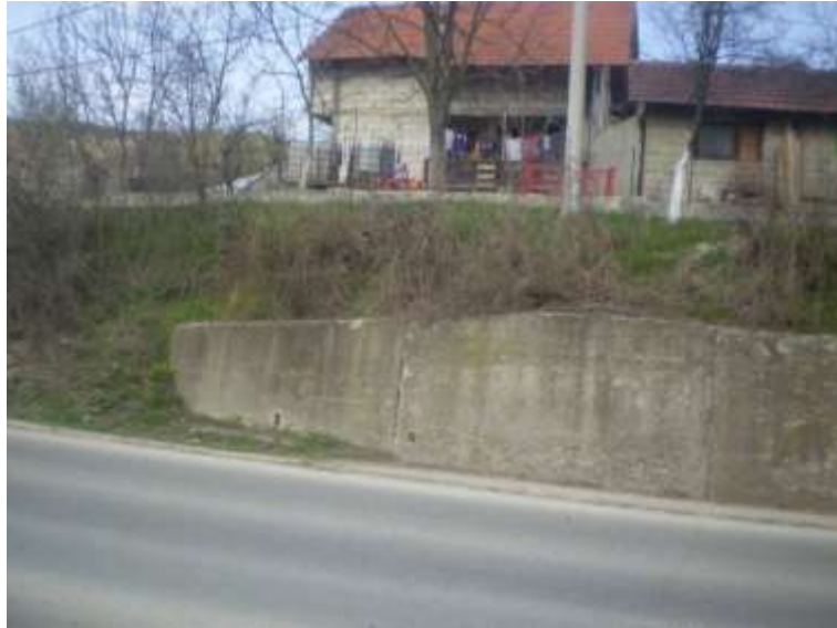
Slika 2. Lokacija gdje se nekada nalazio Babajića han