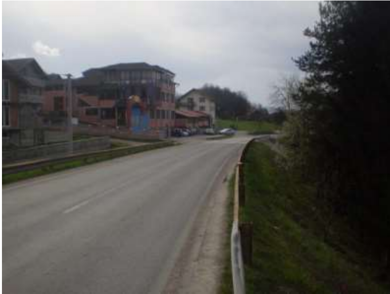
Slika 1. Pogled sa lokacije nekadašnjeg Malagić hana

imenom Malagića han. 2 On se nalazio uz sami današnji magistralni put M-4, desetak metara udaljen od prodajnog objekta firme „Ahi-trade“ na ušću Babajićkog potoka i potočića koji dolazi sa lokaliteta „Suvat“. Izbor lokacije za gradnju hana na ušću dvaju potoka nije slučajna jer je bez vode funkcionisanje objekata ove vrste bilo nezamislivo. Kada je ovaj han prestao sa radom nije poznato ali je sigurno da je prestao sa radom prije početka Prvog svjetskog rata. 3 Neposredno pred Prvi svjetski rat zemljište na kome se nalazio han kao i okolne parcele koje su bile u vlasništvu porodice Malagić prešli su u vlasništvo porodice Babajić koji su inače bili vlasnici Babajić hana. 4