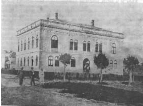
Trgovačka – građanska škola u Tuzli (Mitar Papić, Školstvo u Bosni i Hercegovini za vrijeme austro-ugarske okupacije, Sarajevo, 1972., str. 132)