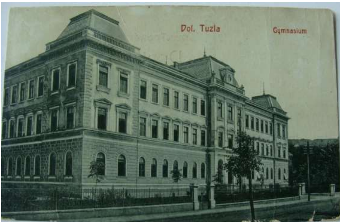
Zgrada Gimnazije (privatna zbirka razglednica akademika Envera Mandžića)