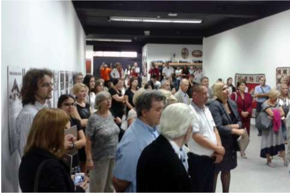
Fotografija 2. Detalj sa izložbe