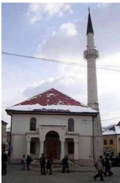
Slika 1. Čaršijska Džamija

Gotovo sve stare kuće iz ovih naselja i velika većina iz okruženja, podrumi, odnosno prvi spratovi su ozidani kamenom iz ovih majdana.