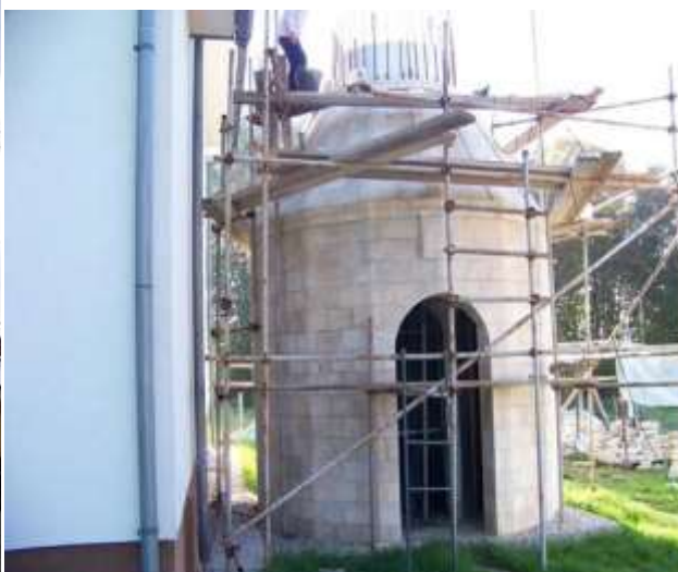
Slika 2. Munara uz džamiju Donje Petrovice kod Pasaca G.

Po pričanju starijih ljudi majdan ovog kamena se nalazio na velikoj dubini i do 20 metara. Dok je još svjež pri vađenju dao se oblikovati veoma lahko. Međutim kada odstoji na vazduhu i suncu skameni se ali ipak se da obrađivati.