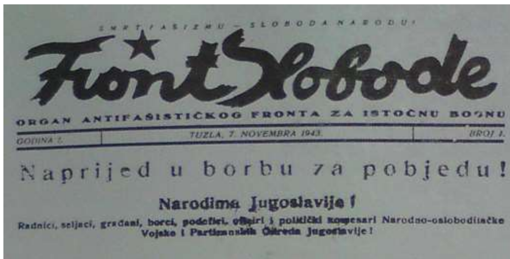
Slika 1. Prvi broj lista "Front slobode". 5

Osnovao ga je Oblasni komitet KPJ za istočnu Bosnu. 3 Prvi broj lista „Front slobode“ rađen je u dosta teškim uslovima, ilustrovan linorezima akademskih slikara Ismeta Mujezinovića i Voje Dimitrijevića. Prvi broj „Fronta slobode“ izašao je u Tuzli u dvobojnoj tehnici, na 24 stranice, a štampan je u Tuzli u štampariji Sekulić. 4