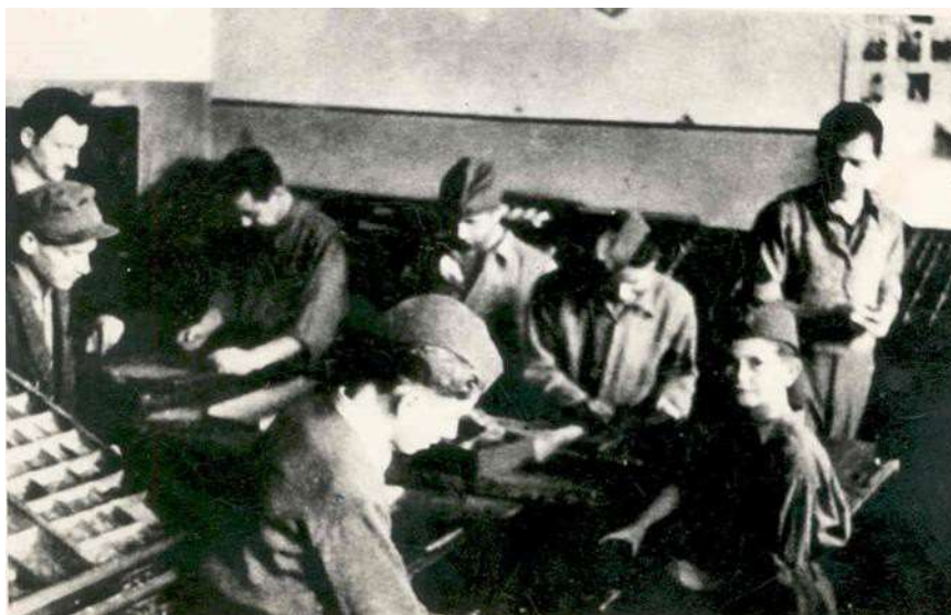
Slika 2. Rad na prvim brojevima tuzlanskog „Fronta slobode“. 9

Do kraja rata izašlo je ukupno 25 brojeva na 236 stranica. Prvi i drugi broj „Fronta slobode“ izašli su 1943. godine, tokom 1944. godine izašli su brojevi od 3 do 11, a u 1945. godini od 12 do 24. Jedno vanredno izdanje, bez numeracije, izašlo je 3. maja, a broj 18 je također izašao vanredno. 10 Tako je „Front slobode“ sa tih 25 ratnih brojeva, i ne samo njih, bio snažno sredstvo političke propagande, poziv na borbu, snažan stub narodnooslobodilačkog pokreta, moćno sredstvo informisanja.