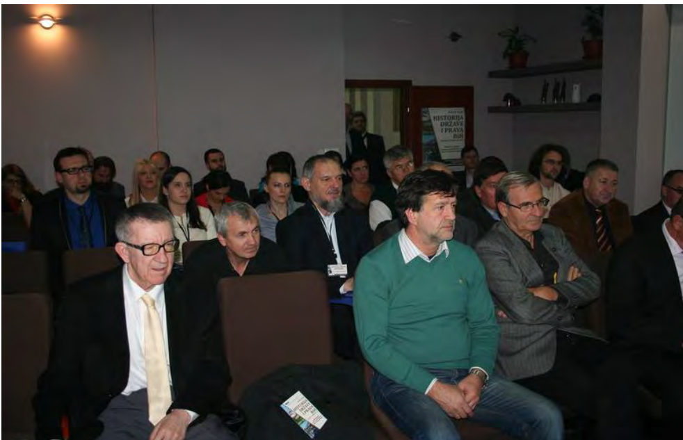
Sl. 1. Detalj sa naučnog skupa